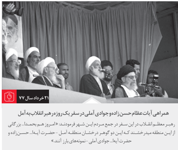
۲۱ خرداد سال ۷۷

روزه بر کودک نابالغ، دیوانه، بیهوش، فردی که توانایی گرفتن روزه ندارد، مسافر، زن حایض و نفسا، کسی که روزه برای او ضرر یا حرج (مشقت زیاد) دارد واجب نیست. ۱. کسی که می‌داند روزه برای او ضرر دارد یا خوف ضرر داشته باشد باید روزه را ترک کند و اگر روزه بگیرد صحیح نیست بلکه حرام است، خواه این یقین و خوف از تجربه‌ی شخصی حاصل شده باشد یا از گفته‌ی پزشک امین یا از منشأ عقلایی دیگر. ۲. هرگاه عقیده‌اش این بود که روزه برای او ضرر ندارد و روزه گرفت و بعد فهمید روزه برای او ضرر داشته باید قضای آن را بجا آورد. ۳. پزشک‌هایی که بیماران را از روزه گرفتن به دلیل ضرر داشتن منع می‌کنند گفته‌ی ایشان در صورتی معتبر است که اطمینان آور باشد یا باعث خوف ضرر شود و در غیر این صورت اعتباری ندارد.